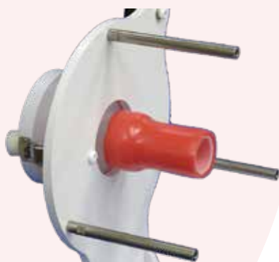
腸管モデル PS 装着時 PS=Purse String Suture